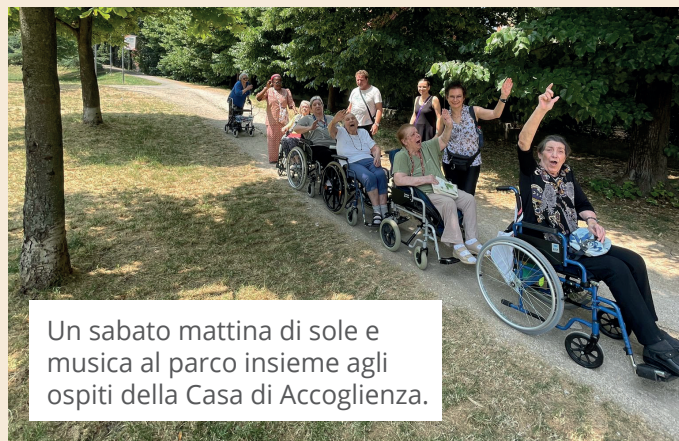
Un sabato mattina di sole e musica al parco insieme agli ospiti della Casa di Accoglienza.

Lo è ogni volta che porto fuori gli ospiti al parco o per il caffè. Vedere i loro visi trasformarsi dopo l'oretta insieme mi riempie davvero di gioia. Sentire i loro mille "grazie!" davvero è una ventata di rinnovata energia. E tutte le volte penso che questi ringraziamenti siano eccessivi rispetto a quanto ricevo io da tutti loro.